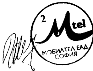
Искра Кусева Пълномощник на изпълнителните директори на „Мобилтел“ ЕАД