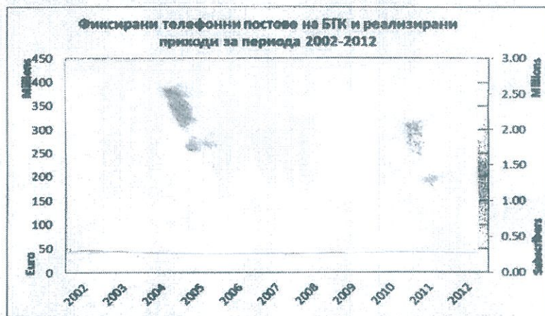
Фиг. 1

По данни от Годишния доклад на КРС за 2011 г., по отношение на пазарния сегмент фиксирана телефонна услуга продължава да е в сила установилата се в последните години трайна тенденция за свиване на пазара. В сравнение с предходната 2010 г. са реализирани с 15.8% по-малко приходи от предоставяне на фиксирани услуги, а общият обем на генерирания от абонатите трафик (в минути), от национални 1 и международни повиквания, за същия период отбелязва намаление с почти 10%. По данни на БТК през 2012 г. се очаква тази тенденция да се запази и дори задълбочи (фиг. 1, търговска тайна за БТК).