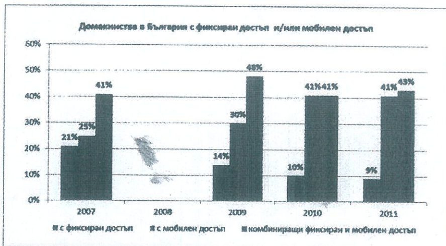
Фиг. 5

Наличието на субституция е безспорен факт, който се подкрепя и проведените от Европейската комисия проучвания E-communications household survey.