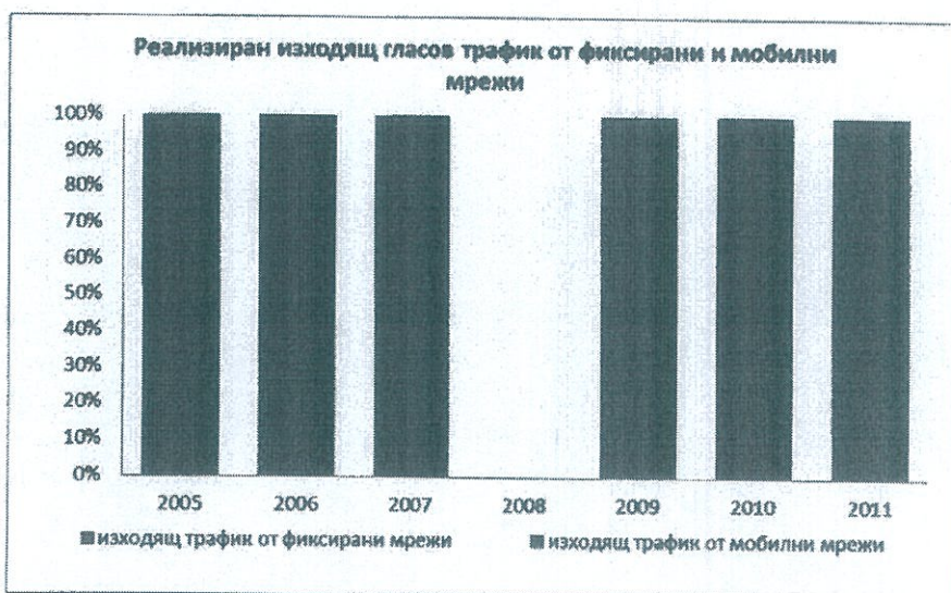
Източник: По данни на КРС 12 Фиг. 4

Така посочените трафични данни ясно показват тенденцията за „свиване“ на фиксираните услуги за сметка на мобилните.