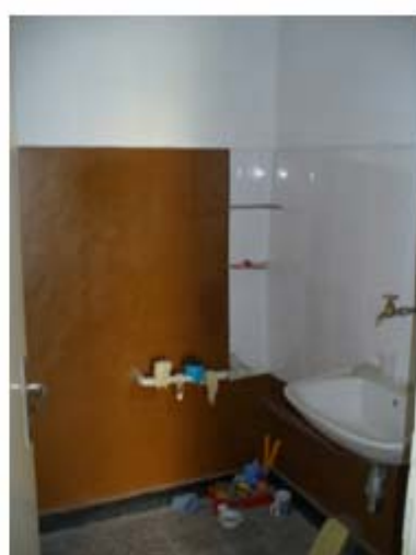
фиг.2 – Снимков материал