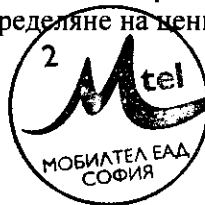
Искра Кусева Пълномощник на изпълнителните директори на "Мобилтел" ЕАД